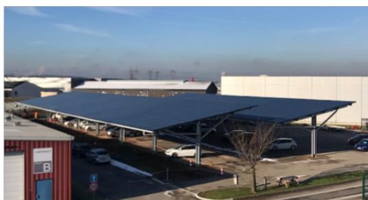
Centrale solaire à Saint-Bonnet-de-Mure (69)