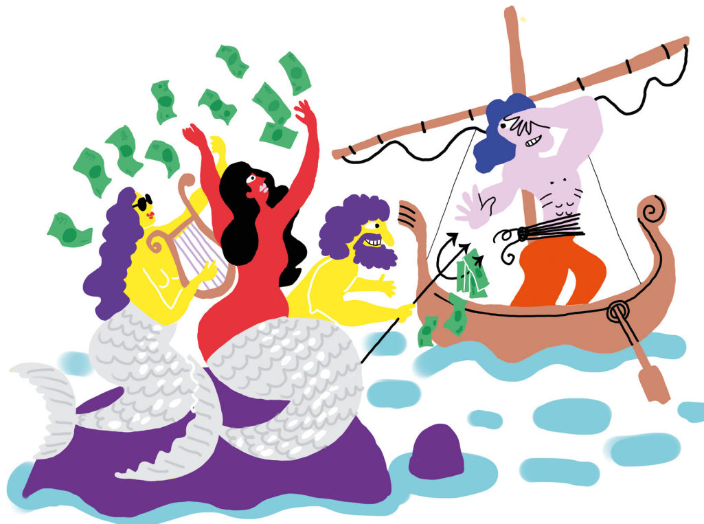
////// Silvana Machado, Directrice Amérique du Sud

En 2021, une formation à l'éthique, obligatoire pour tous, a été mise à jour et adaptée en sept langues, afin que l'apprentissage de bons réflexes soit encore plus simple. Cette formation est intégrée au parcours de tous les nouveaux arrivants et un rappel est obligatoire pour les managers tous les deux ans. Si elle est accessible à tous, la formation à l'anticorruption est quant à elle uniquement obligatoire pour les collaborateurs dont les fonctions les exposent plus directement (vente, finance, achats, management).